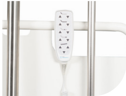
Afstandsbediening intuïtief gebruik