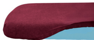
Molton In meerdere kleuren beschikbaar