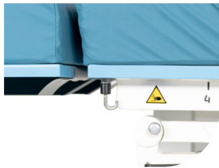
Katheterzakhaak Aan twee kanten