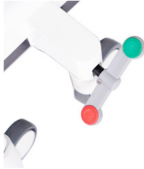
Rem signaal Bij stekker in het stopcontact