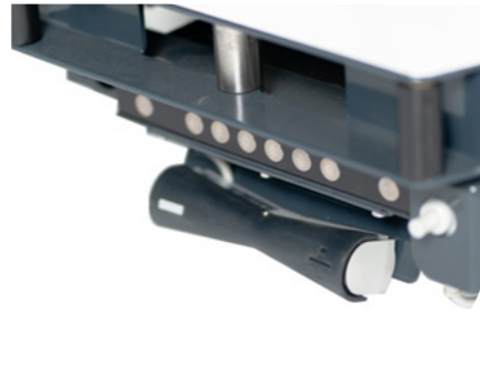
Hoogteverstelling Met elektrische voetschakelaar