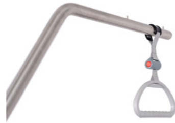
Papegaaisteun inclusief verstelbaar handvat