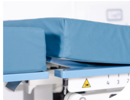
Bekkenkantel gedeelte Elektrisch verstelbaar