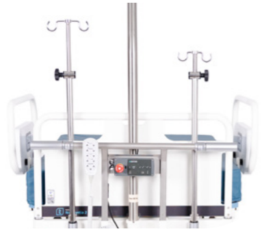
Infuuspalen Twee stuks in hoogte verstelbaar