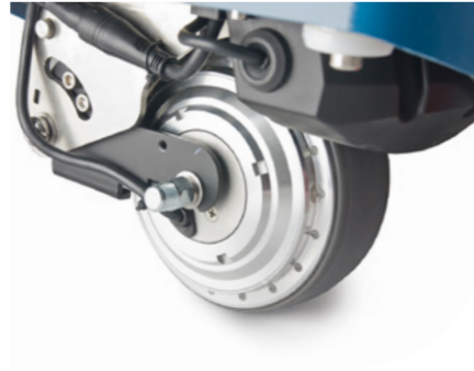
Elektrische aandrijving Met één vinger te verrijden